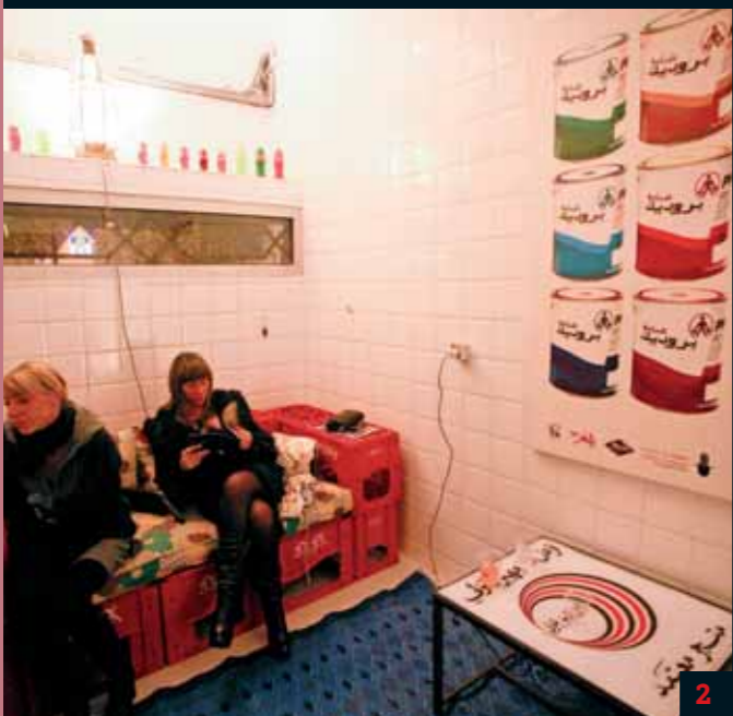
2. Un salon façon Hassan Hajjaj, qui se définit lui-même comme Pop Artist, cela donne un regard décalé sur les intérieurs marocains et sur la course à la consommation. Sa performance malicieusement intitulée Andy Wahloo a fait sourire et s'asseoir (sur des caisses de Coca Cola) plus d'un.