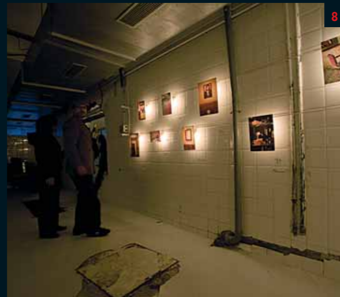
8. Succès mérité des fragiles photos de Deborah Benzaquen, qui disent sa relation au Maroc et le regard furtif mais touchant qu'elle porte sur les deux ou trois petites choses du quotidien bien de chez nous.

TEXTE ILLY NAÏT LAHCEN PHOTOS MOHCINE BERRADA ET SIFE EDDINE EL AMINE