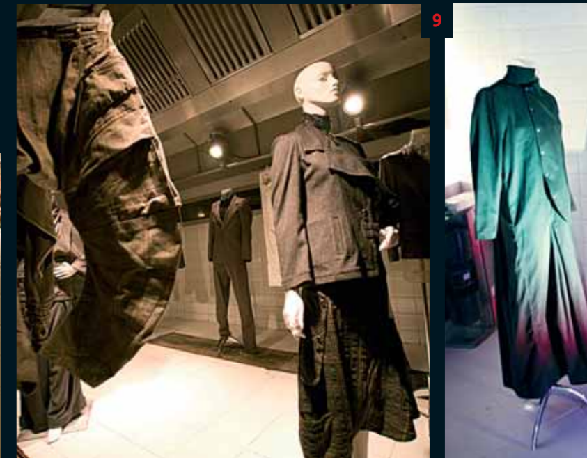
9. Le clou de la soirée : les créations de Amine Bendriouich. A priori stricts, ses costumes, vestes et autres pantalons, à la découpe déstructurée mais soignée, sont, quand on les regarde de plus près, à l'image du garçon lui-même : délutés.